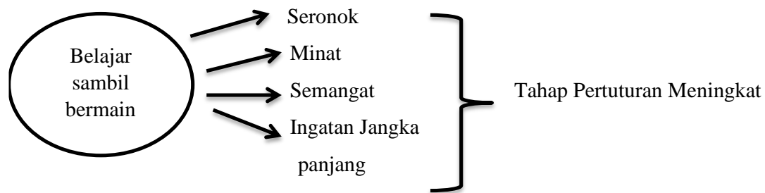
Rajah 1: Menunjukkan kerangka teoritikal kajian ini

Dalam kerangka kajian ini terdapat empat aspek yang penting iaitu dalam pendekatan belajar melalui bermain menunjukkan keseronokkan, minat, semangat dan ingatan jarak panjang sekiranya pendekatan ini dilaksanakan dengan cara yang betul. Jika pendekatan dan penglibatan kanak-kanak berjaya maka pertuturan kanak-kanak akan meningkat seperti dalam Rajah 1.