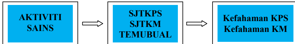
Rajah 1: Reka Bentuk Kajian

SJTKPS dan SJTKM diberikan kepada guru pelatih setelah mereka melaksanakan aktiviti amali. Tiga orang guru pelatih dipilih untuk ditemu bual bagi mengenal pasti pendapat mereka tentang kemahiran saintifik yang terlibat di dalam amali yang telah mereka lakukan. Pengkaji telah memilih tiga orang guru sains sebagai responden secara persampelan bertujuan ( purposeful sampling ) yang bermaksud pemilihan sampel untuk memenuhi keperluan kajian. Creswell (2002) serta Bogdan dan Biklen (2003) menyatakan, melalui purposeful sampling , responden yang dipilih merupakan responden terbaik yang dapat memberi sumber maklumat yang maksimum bagi membantu memahami fenomena yang dikaji.